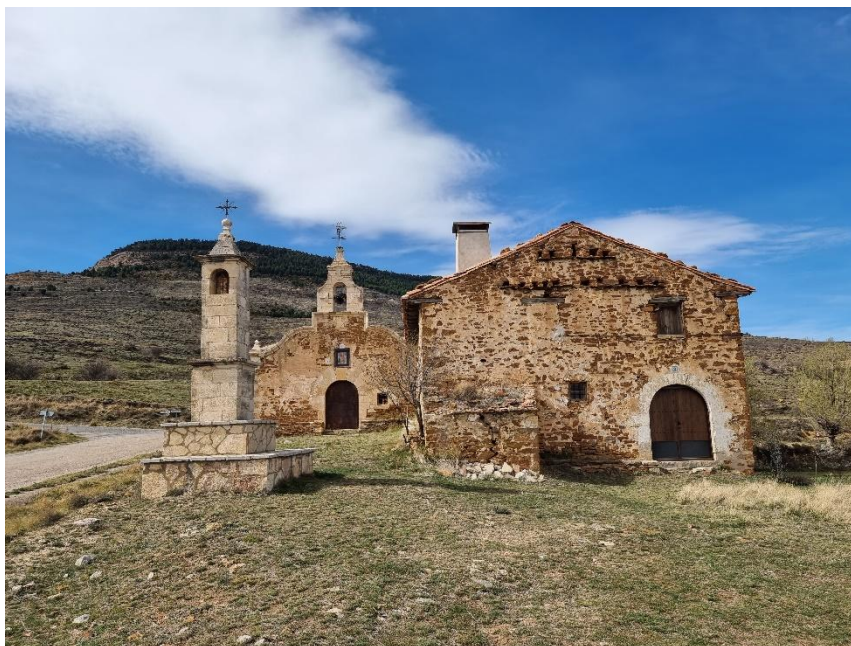
Ermita de San Cristóbal en Cantavieja (Teruel).