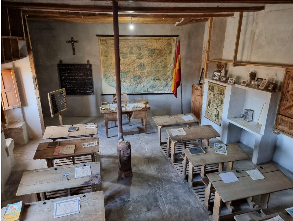
Escuela de Cañada de Betananduz (Teruel).