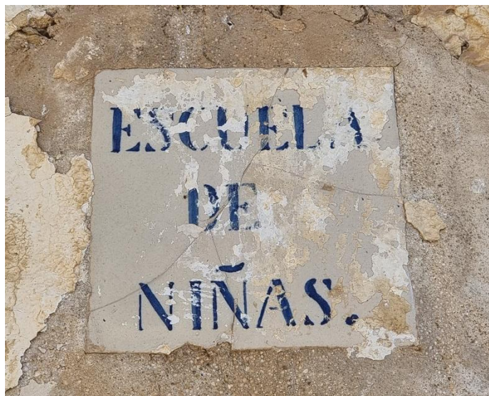
Cañada de Benatanduz (Teruel).