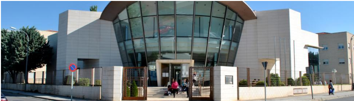
Universidad de Zaragoza. Campus de Teruel.