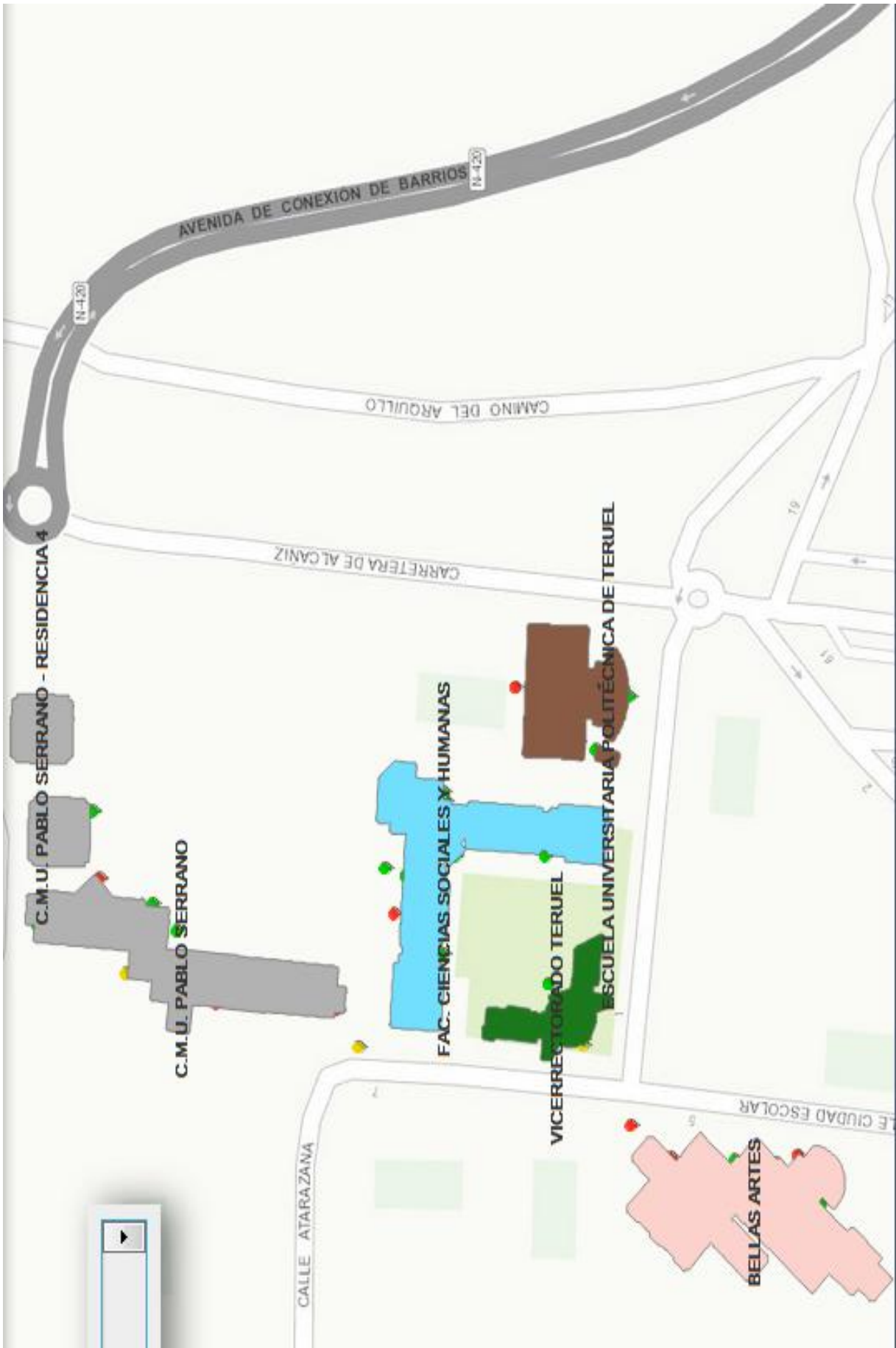
Plano de las instalaciones del Campus de Teruel de la Universidad de Zaragoza