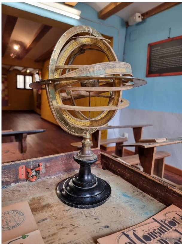
Escuela de La Cuba (Teruel).