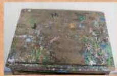
Limpieza de la tapa de forma mecánica