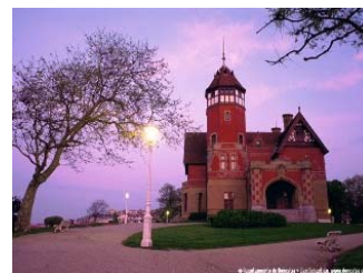
Palacio de Miramar, sede del evento