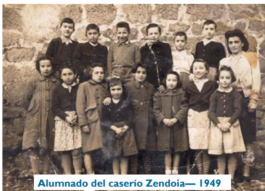
Alumnado del caserío Zendoia— 1949

Este encuentro agrupa las VII Jornadas Científicas de la SEPHE (Sociedad Española para el Estudio del Patrimonio Histórico-Educativo) y el V