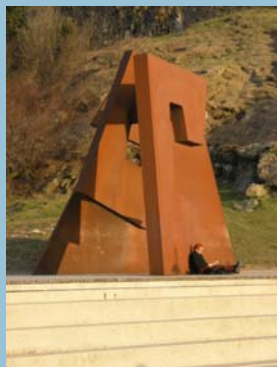
Construcción vacía de Jorge Oteiza. Donostia-San Sebastián